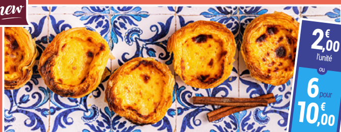
Pastel de Nata